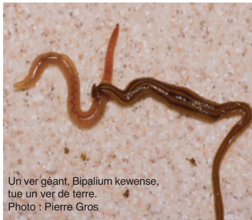
Un ver géant, Bipalium kewense, tue un ver de terre.

E n France, les BIPALIUM, vers géants pouvant atteindre 40 cm- venus de Chine, dévorent nos lombrics, Attention ils sont gluants et toxiques. Il ne faut pas les toucher, Mettez des pièges dans vos jardin pour les tuer : -briques plates, ils se cachent dessous comme les limaces. C'est sérieux et grave. Sans lombrics la terre va mourir et plus de plantes,