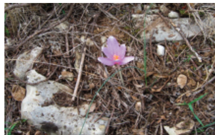
photo prise chemin de La Cigale 150m après le pont

Appelé encore « crocus d'automne » ou « safran des près » le colchique possède une fleur qui ressemble à un crocus géant mais qui se distingue par ses six étamines au lieu de trois. Par ailleurs portez des gants lorsque vous manipulez les bulbes au moment des plantations, leur contact peut provoquer des irritations cutanées.